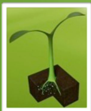
Enfouissement de SolSain S : les spores se multiplient

La forme solide de SOLSAIN S se trouve particulièrement adapté pour le traitement de sols chauds (riches en matière organique)